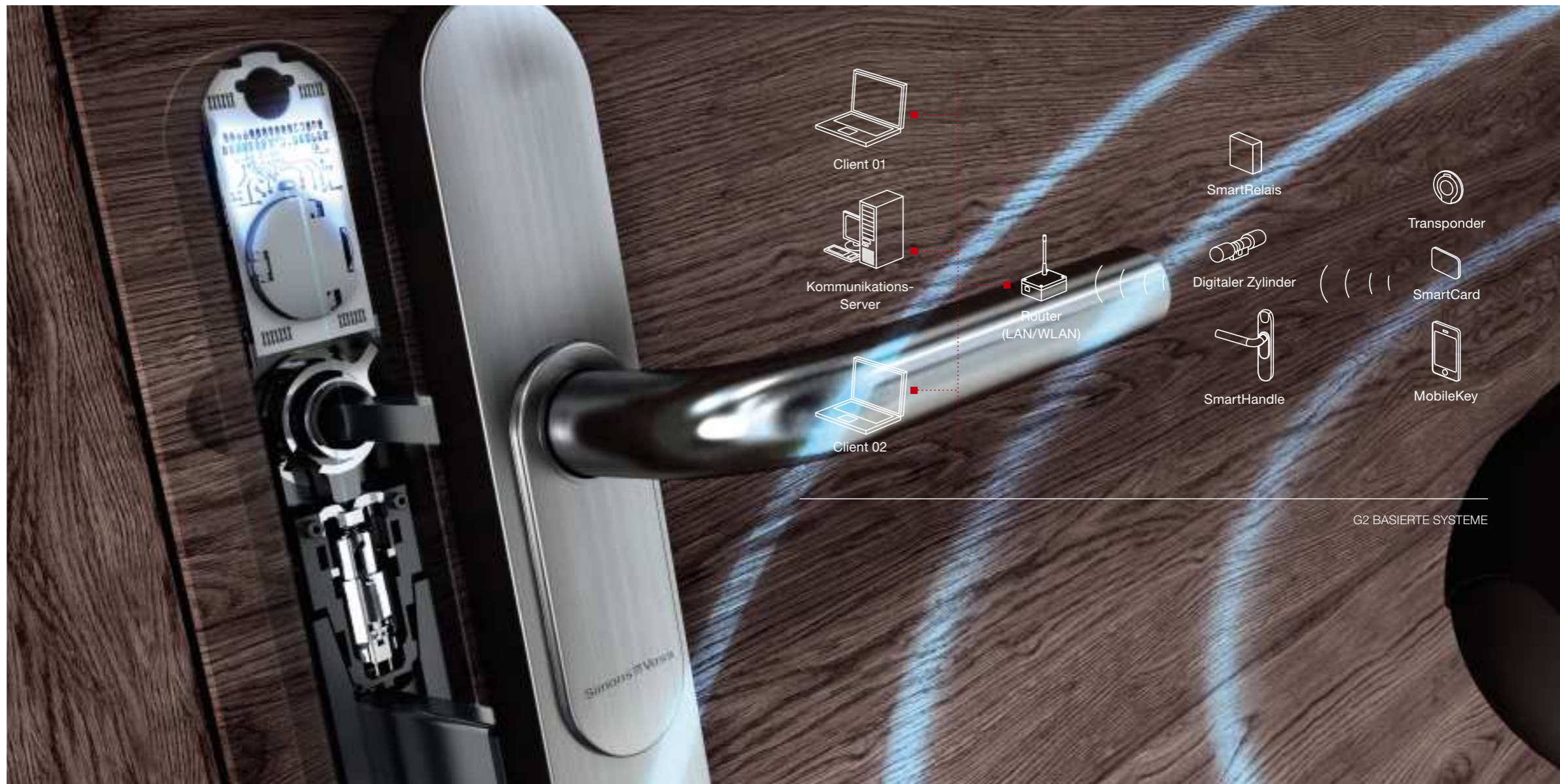
G2 BASIERTE SYSTEME

Elektronische Zutrittskontrollsysteme ersetzen die mechanischen Schlüssel und Schlösser durch ein einfach zu verwaltendes sicheres System, welches die genannten Risiken eliminiert. Schützen Sie unabhängig von der Größe Ihrer Unternehmung Mensch und Vermögenswerte vor Diebstahl und Vandalismus.